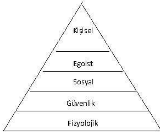
Şekil 1.2 McGregor'un Çalışan Motivasyonu Hiyerarşisi

American Psychological Association. (2001). Publication Manual of the American Psychological Association. Washington, DC: American Psychological association. http://owl.english.purdue.edu/owl/resource/560/01/